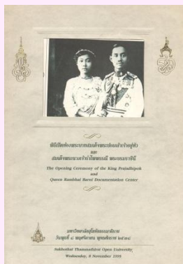
สูจิบัตร

สนใจข้อมูล ภาพ สูจิบัตรหรือหนังสือที่เกี่ยวข้องกับเรื่องดังกล่าว ติดต่อได้ที่หน่วยจดหมายเหตุมหาวิทยาลัย ฝ่ายบริการ-สารสนเทศ สำนักบรรณสารสนเทศ โทร. 7467-8