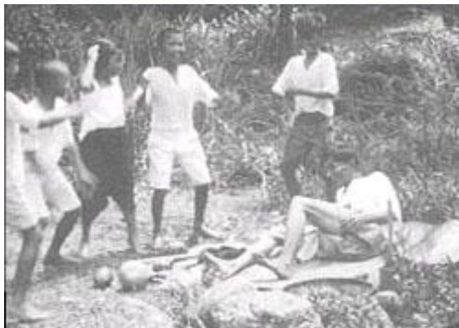
ภาพยนตร์เรื่อง แหวนวิเศษ

เรื่องพระเจ้ากรุงจีนเป็นภาพยนตร์แนวตลกล้อเลียน เป็นเรื่องของชาวตะวันตกที่ไปเข้าเฝ้าฯ พระเจ้ากรุงจีน แต่ไม่ยอมปฏิบัติตามธรรมเนียมจีน พระเจ้ากรุงจีนก็ริ้ว ส่งให้นำตัวไปประหารแต่เปลี่ยนพระทัยให้นำตัวมาเข้าเฝ้าฯ ใหม่ จึงกราบบังคมทูลเรื่องธรรมเนียมฝรั่งให้ทรงทราบ แต่เรื่องนี้ยังไม่ได้ทรงตัดต่อและประกอบคำบรรยาย