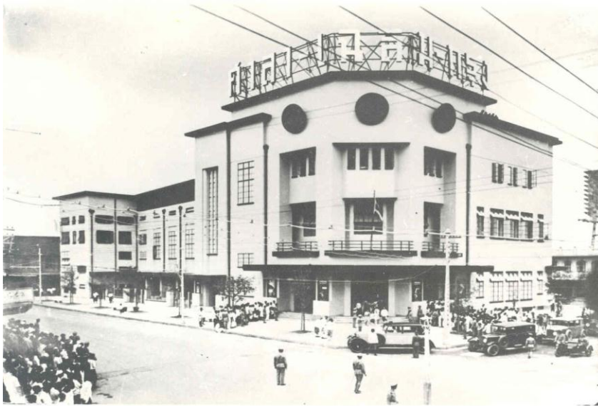
โรงภาพยนตร์ศาลาเฉลิมกรุง