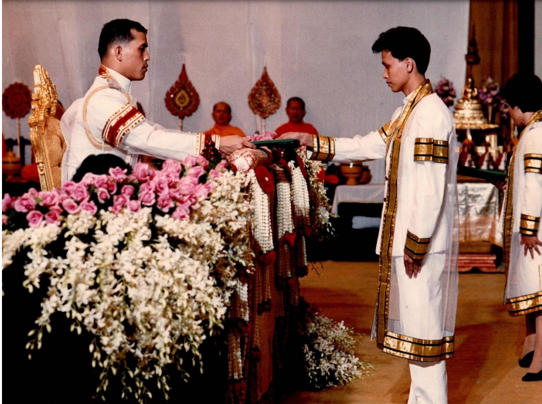
สมเด็จพระเจ้าอยู่หัวมหาวชิราลงกรณ บดินทรเทพยวรางกูร เสด็จพระราชดำเนินพระองค์ พระราชทาน ปริญญาบัตรแก่บัณฑิต มสธ. ประจำปีการศึกษา 2526 เมื่อวันที่ 13-15 และ วันที่ 19-22 มีนาคม พ.ศ. 2528 ณ อาคารใหม่ สวนอัมพร